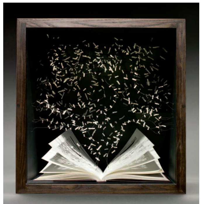
Su Blackwell (*1975): The Book of the Lost, 2010