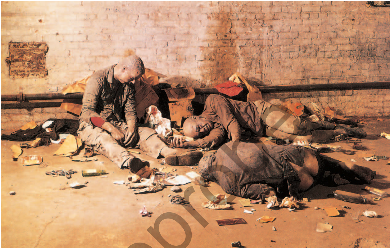
Duane Hanson (1925–1996): Homeless Persons, 1969/70

Glauben an einen guten Gott und an den konkreten Lebenssituationen der Menschen, vor allem aber an der Gerechtigkeit orientiert (1.3.2). Schließlich wendet sich die Angewandte Ethik konkreten Fällen und Fragestellungen zu (1.3.3).