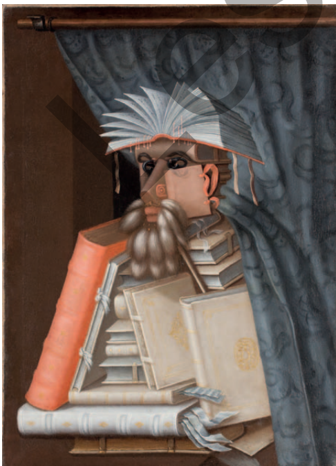
Giuseppe Arcimboldo (um 1526–1593): Der Bibliothekar, um 1560–1570