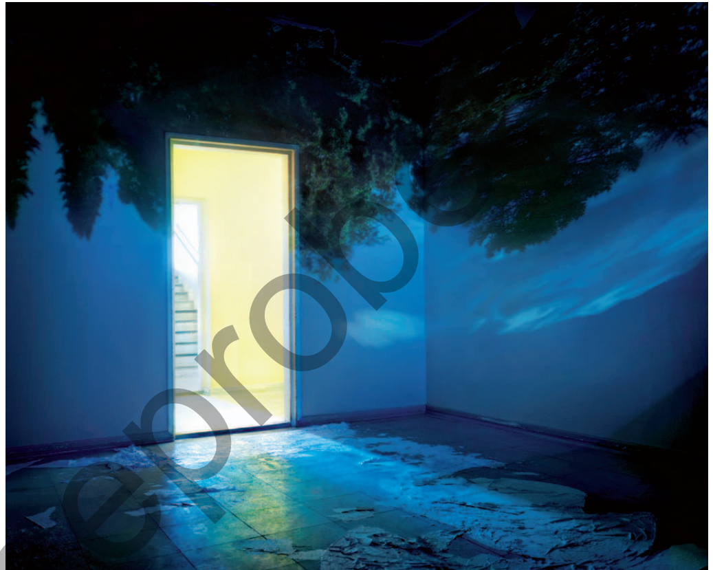
Marja Pirilä (*1957): Speaking House 6, 2006